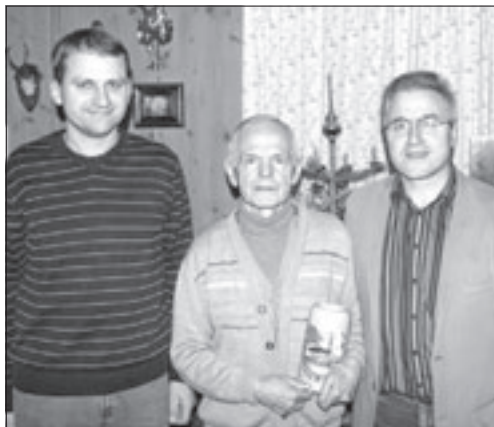
Der Jubilar mit den Gratulanten der OG

rüstig und aktiv, wie viele sich das wünschen würden. Mit einem Geschenk und den besten Glückwünschen gratulierte die OG dem Jubilar.