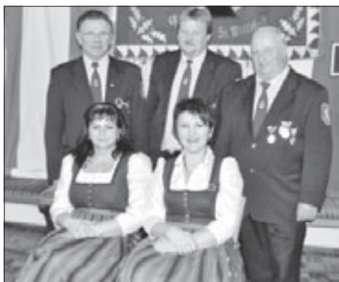
Die feschen Marketenderinnen mit den Sponsoren der neuen Dirndl