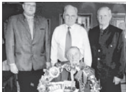
Der Jubilar mit den Gratulanten des Vorstandes