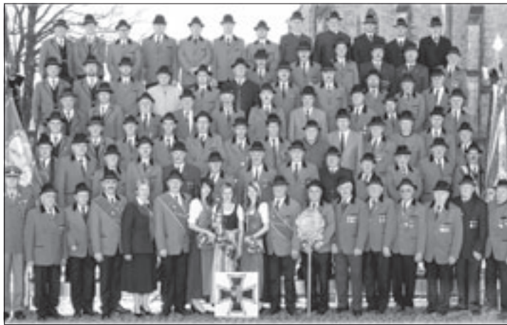
Foto der OG Handenberg anlässlich ihres 100-jährigen Bestehens.