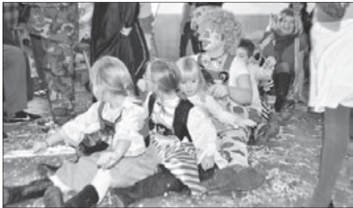
Die Kinder hatten viel Spaß und sorgten für ausgelassene Stimmung.